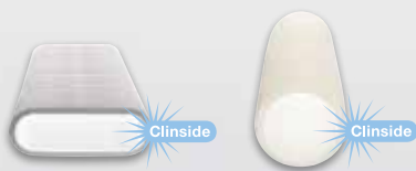
Zehnder ComfoTube flat 51 / ComfoTube