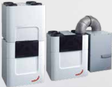
Zehnder ComfoCool Q / ComfoFond-L Q