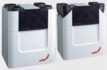
Zehnder ComfoAir Q